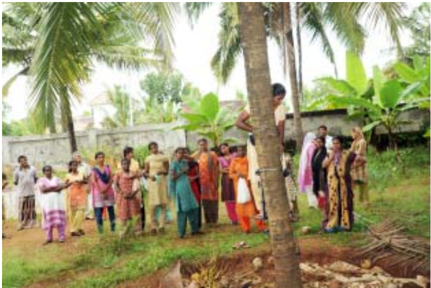
വനിതകൾ ചങ്ങാതിക്കൂട്ടം പരിശീലനത്തിൽ

ചില പ്രശ്നങ്ങളും നേരിടുന്നുണ്ട്. അതിൽ ഏറ്റവും പ്രധാനമായി അവർ കാണുന്നത് തെങ്ങുകയറ്റ യന്ത്രം ഉപയോഗിച്ച് തെങ്ങുകയറുമ്പോൾ സുരക്ഷയെ കുറിച്ചുള്ള ആശങ്കയാണ്. കടന്നൽ പോലുള്ള ക്ഷുദ്ര ജീവികളുടെ ഉപദ്രവവും ചിലപ്പോൾ പ്രശ്നമാകാറുണ്ട്. മച്ചിങ്ങയും ഉണങ്ങിയ തേങ്ങയും മറ്റും അടർന്ന് വീണ് അപകടം സംഭവിക്കാനുള്ള സാധ്യതയുമുണ്ട്. ഇത്തരം സാഹചര്യങ്ങളെ നേരിടാൻ തലയ്ക്ക് ക്ഷതമേൽക്കാത്ത രീതിയിലുള്ള തൊപ്പി ഉൾപ്പെടെ മാന്യമായ ഒരു ഡ്രസ്സ് കോഡും സുരക്ഷാബെൽറ്റും വേണമെന്ന് ഇവർ അഭിപ്രായപ്പെടുന്നു.