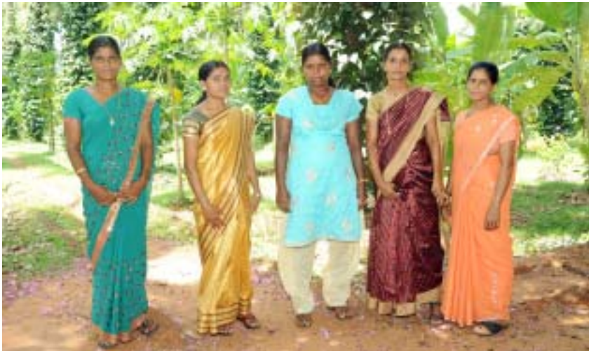
കുറ്റിക്കോൽ പഞ്ചായത്തിലെ വനിത കൂട്ടായ്മ

തങ്ങളുടെ ജീവിതം കരുപ്പിടിപ്പിക്കാൻ ഈ പരിശീലന പരിപാടി വഴി കഴിഞ്ഞതായി അവർ ഏകസന്ദർഭത്തിൽ പറയുന്നു. യന്ത്രം ഉപയോഗിച്ച് ഒട്ടും ആയാസമില്ലാതെ തെങ്ങുകയറി വിളവെടുപ്പ് മാത്രമല്ല, മണ്ട വൃത്തിയാക്കൽ തുടങ്ങിയ പണിയും ഇവർ നിഷ്പ്രയാസം ചെയ്യുന്നു. സ്ത്രീകൾ യന്ത്രവുമായി തെങ്ങുകയറുന്നത് ഭയപ്പാടോടെയും ചിലപ്പോൾ ഒട്ടു പരിഹാസത്തോടെയും കണ്ടിരുന്ന മറ്റ് കുടുംബാംഗങ്ങളും അയൽക്കാരും ഇന്ന് സർവ്വവിധ പിന്തുണയുമായി ഇവർക്കൊപ്പമുണ്ട്. എന്നിരുന്നാലും മണ്ണിൽ ചവിട്ടി നിന്ന് ചെയ്യാൻ പറ്റുന്ന പണികൾ മാത്രം സ്ത്രീകൾ ചെയ്യാൻപോരേ എന്നാശങ്കപ്പെടുന്നവരും കുറവല്ല. ആദ്യം ഒന്നു രണ്ടു തോട്ടത്തിലെ വിളവെടുപ്പ് ഇവർക്ക് ഏർപ്പാടാക്കിക്കൊടുത്തത് ഇവരുടെ കുടുംബാംഗങ്ങൾ തന്നെയായിരുന്നു. അതിനുശേഷം കേരകർഷകർ തന്നെ അവരെ മറ്റു തോട്ടങ്ങളിലേക്ക് ശുപാർശ ചെയ്യുകയായിരുന്നു.