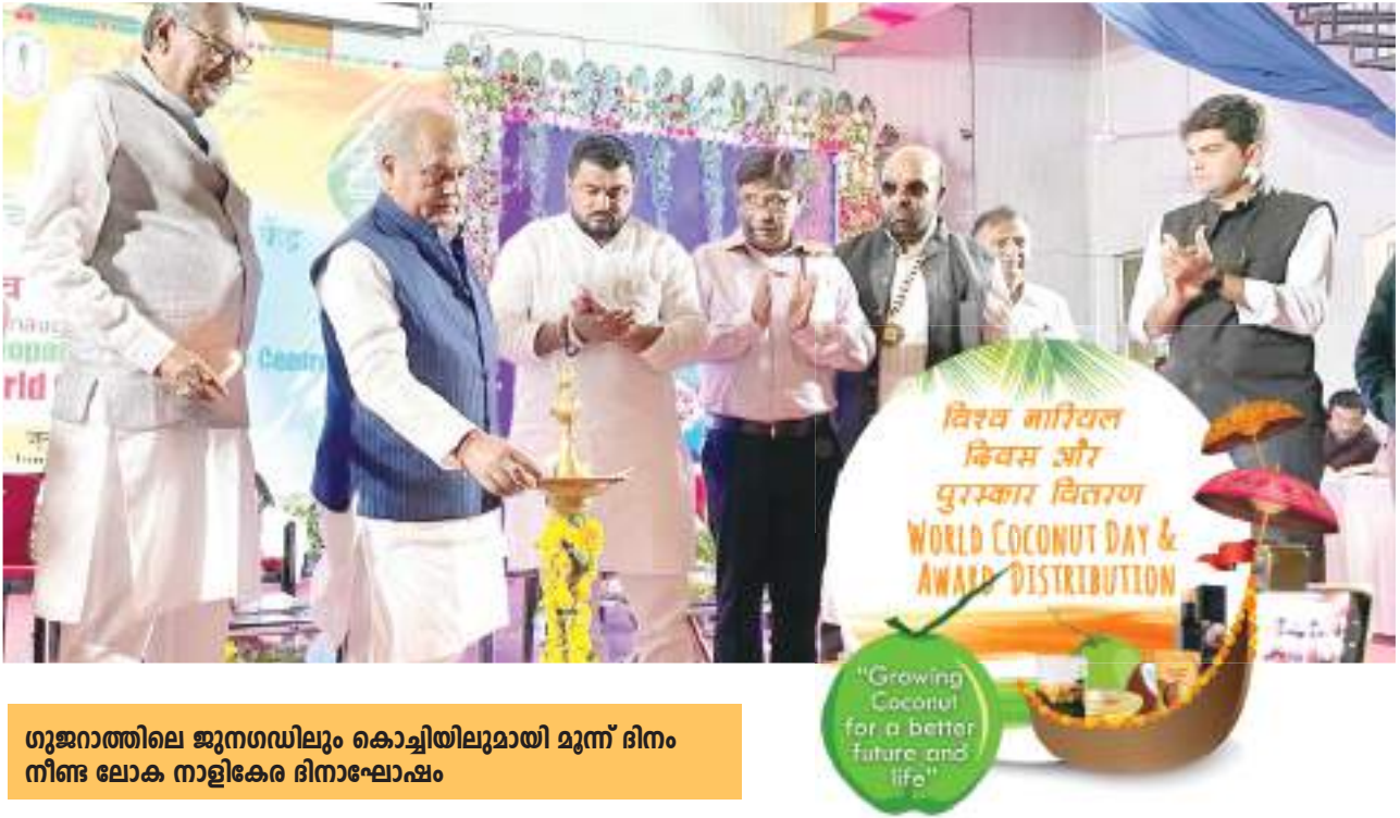
ഗുജറാത്തിലെ ജനഗഡിലും കൊച്ചിയിലുമായി മൂന്ന് ദിനം നീണ്ട ലോക നാളികേര ദിനാഘോഷം

24-ാമത് ലോക നാളികേര ദിനത്തോടനുബന്ധിച്ച് 2022 സെപ്റ്റംബർ 2 ന് രാജ്യത്ത് ഇക്കൂറി വിപുലമായ പരിപാടികൾ സംഘടിപ്പിക്കപ്പെട്ടു. ഇന്ത്യയിലെ രണ്ടു സംസ്ഥാനങ്ങളിൽ മൂന്നു വേദികളിലായി നടന്ന വൈവിധ്യമാർന്ന പരിപാടികൾക്ക് രാജ്യത്തിനകത്തും പുറത്തും നിന്നുള്ള കർഷക പ്രതിനിധികളും ഉദ്യോഗസ്ഥരും സാക്ഷ്യം വഹിച്ചു.