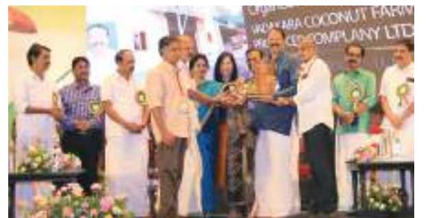
തയ്യാറാക്കിയത്: ആബെ ജേക്കബ്

രജിസ്ട്രാർ ഓഫ് കമ്പനീസിന്റെ കീഴിൽ 2015 ൽ രജിസ്റ്റർ ചെയ്ത കമ്പനിയാണ് വടകര നാളികേര കർഷക ഉൽപാദക കമ്പനി. 6 കോടി രൂപ അംഗീകൃത മൂലധനവും 4.50 കോടി രൂപ അടച്ചു തീർത്ത മൂലധനവുമായി പ്രവർത്തനം തുടങ്ങിയ കമ്പനിയുടെ കീഴിൽ 152 ഉൽപാദക സംഘങ്ങളും, 12 ഉൽപാദക ഫെഡറേഷനുകളുമാണ് ഉള്ളത്. കോഴിക്കോട് ജില്ലയിലെ വടകര, കൊയിലാണ്ടി താലൂക്കുകളാണ് പ്രവർത്തന മേഖല. 5000 ലിറ്റർ നീരയും 15000 ലിറ്റർ വെളിച്ചെണ്ണയും പ്രതിദിന ഉൽപാദന ശേഷിയുള്ള കമ്പനി നാളികേര മേഖലയിൽ മികച്ച പ്രവർത്തനമാണ് കാഴ്ച വയ്ക്കുന്നത്. തേങ്ങാ വെള്ളത്തിൽ നിന്ന് ശീതളപാനീയം, വിനാഗിരി, നീരയിൽ നിന്നു ശർക്കര, പഞ്ചസാര, ചോക്കലേറ്റ്, പാനി, വിനാഗിരി, വിർജിൻ കോക്കനട്ട് ഓയിൽ, വെഗ്നി വാഷ്, ചിപ്സ്, കോയർപിത്ത് തുടങ്ങിയ ഉൽപ്പന്നങ്ങൾ ഡി കോക്കോസ് എന്ന വ്യാപാര നാമത്തിൽ, കമ്പനി വിപണിയിൽ ഇറക്കിയിട്ടുണ്ട്. കമ്പനിയുടെ 2018 -19 ലെ വിറ്റുവരവ് 12.96 ലക്ഷം രൂപയാണ്.